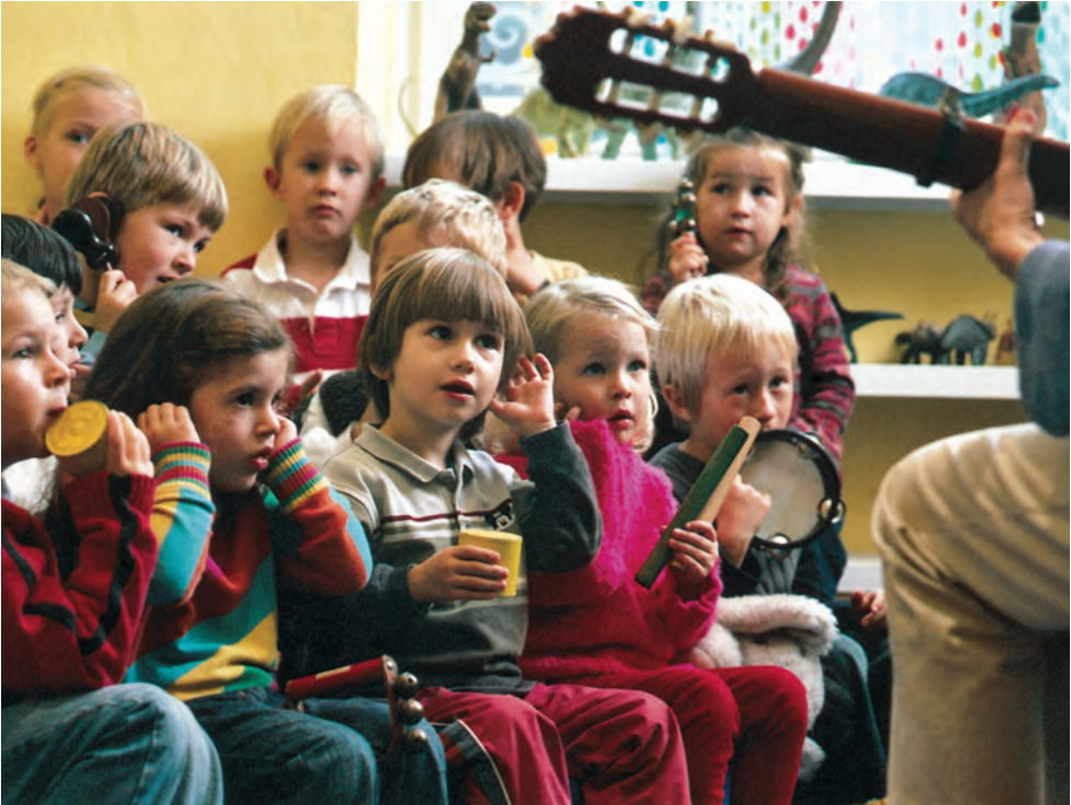
Musik weckt Aufmerksamkeit und Konzentration