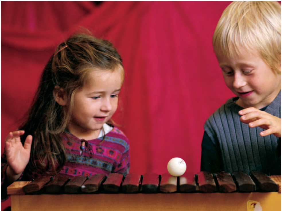
Ping-pong-Klänge auf dem Xylophon: ein Zusammenspiel von Auge, Ohr und Hand

keit zur Konzentration. Im musikalischen Miteinander entdecken sie die eigene Kreativität und gleichzeitig die Beziehung mit anderen. Hier können Kinder durch Erfahrung lernen.