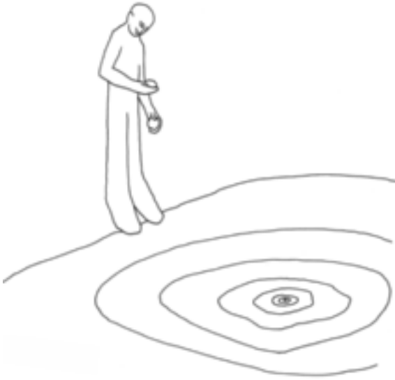
Abbildung 2 Wellenausbreitung in einem Teich.