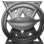
Paragon des Geschmacks »Die Zunge spricht die Wahrheit!« Die Aufrichtigen