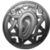
Paragon des Klangs »Die Ohren hören alles!« Die Geduldigen