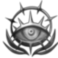
Paragon der Sicht »Die Augen sehen klar!« Die Weisen