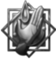
Paragon der Berührung »Die Hand kennt keine Furcht!« Die Tapferen