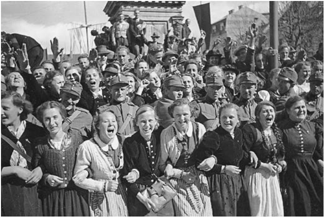
Begeisterung bei der Ankunft Hitlers in Klagenfurt

breiten Absätzen, ohne Ohrringe, möglichst ohne Vermögen. Vermittler abgelehnt, Verschwiegenheit zugesichert.« 28